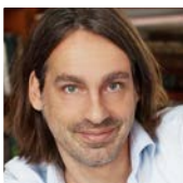
Richard David Precht Philosoph und Publizist

Ich unterstütze die Initiative zur Abschaffung der Massentierhaltung in der Schweiz mit ganzem Herzen und klarem Verstand. Massentierhaltung gehört nicht mehr in unsere Zeit!